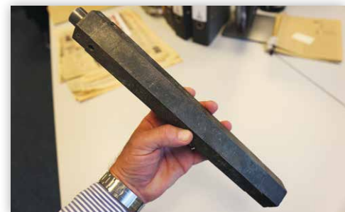
Es fehlte den Kriegsparteien nicht an Kreativität beim Design von Abwurfmunition. Unser Bild zeigt eine Stabbrandbombe mit einem Gewicht von 4lbs (rund 1,8kg). Ein Einschlag dieses Kalibers lässt sich allerdings in Luftkriegsaufnahmen nicht direkt nachweisen.