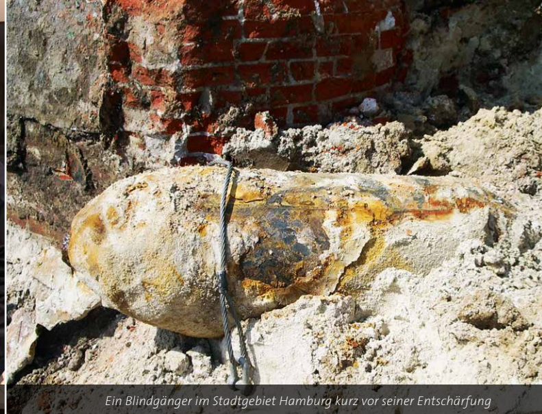
Ein Blindgänger im Stadtgebiet Hamburg kurz vor seiner Entschärfung