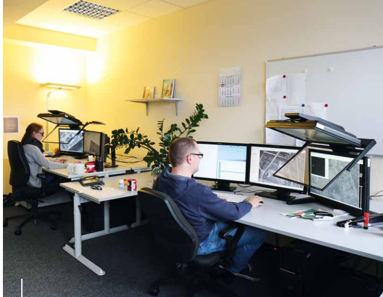
Die Feuerwehr Hamburg betreibt insgesamt 20 Arbeitsplätze mit passiv 3D-Stereomotoren zur Fernerkundung von Gefahrenquellen.