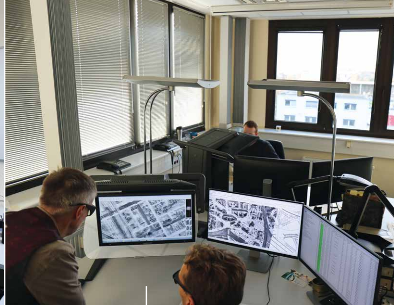
Der 3D PluraView ermöglicht die präzise, stereoskopische Bildauswertung in höchster Bildqualität. Mit dem Monitor kann ermüdungsfrei den ganzen Tag – auch bei Tageslicht – gearbeitet werden.

1, 2 & 3 Hamburg gehört zu jenen Städten Deutschlands, die im Zweiten Weltkrieg am schwersten gelitten haben. So entsprach das in der Hansestadt zerstörte Wohnungsvolumen dem Gesamtwohnungsbestand der Städte Nürnberg, Augsburg, Ludwigshafen, Würzburg und Regensburg zusammen. Bild 2 zeigt eine Luftbildaufnahme der zerstörten Kirche St. Nikolai, Bild 3 die Kriegseinwirkungen im Bereich Hamburg-Wilhelmsburg.